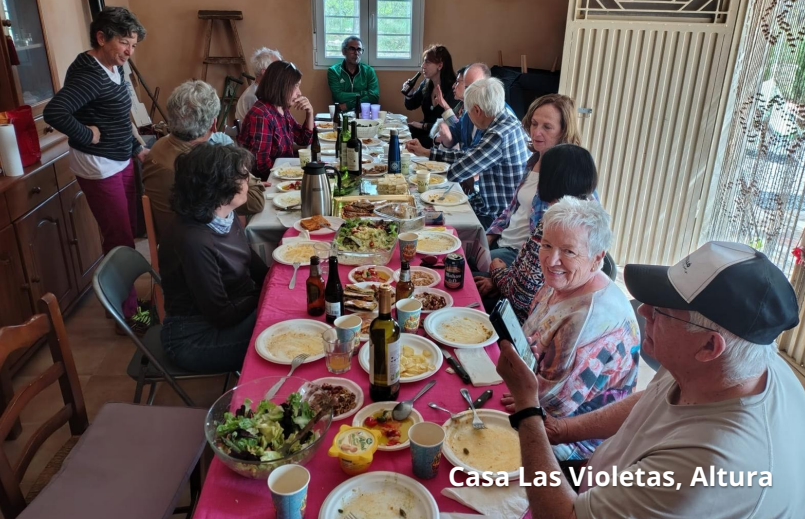
Casa Las Violetas, Altura